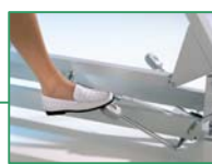
126 023 Hydraulisch mit Fußpedalen