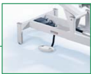
126 022 Elektrisch mit Fußschalter