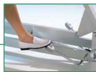
126 003 Hydraulisch mit Fußpedalen