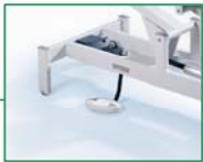
126 002 Elektrisch mit Fußschalter